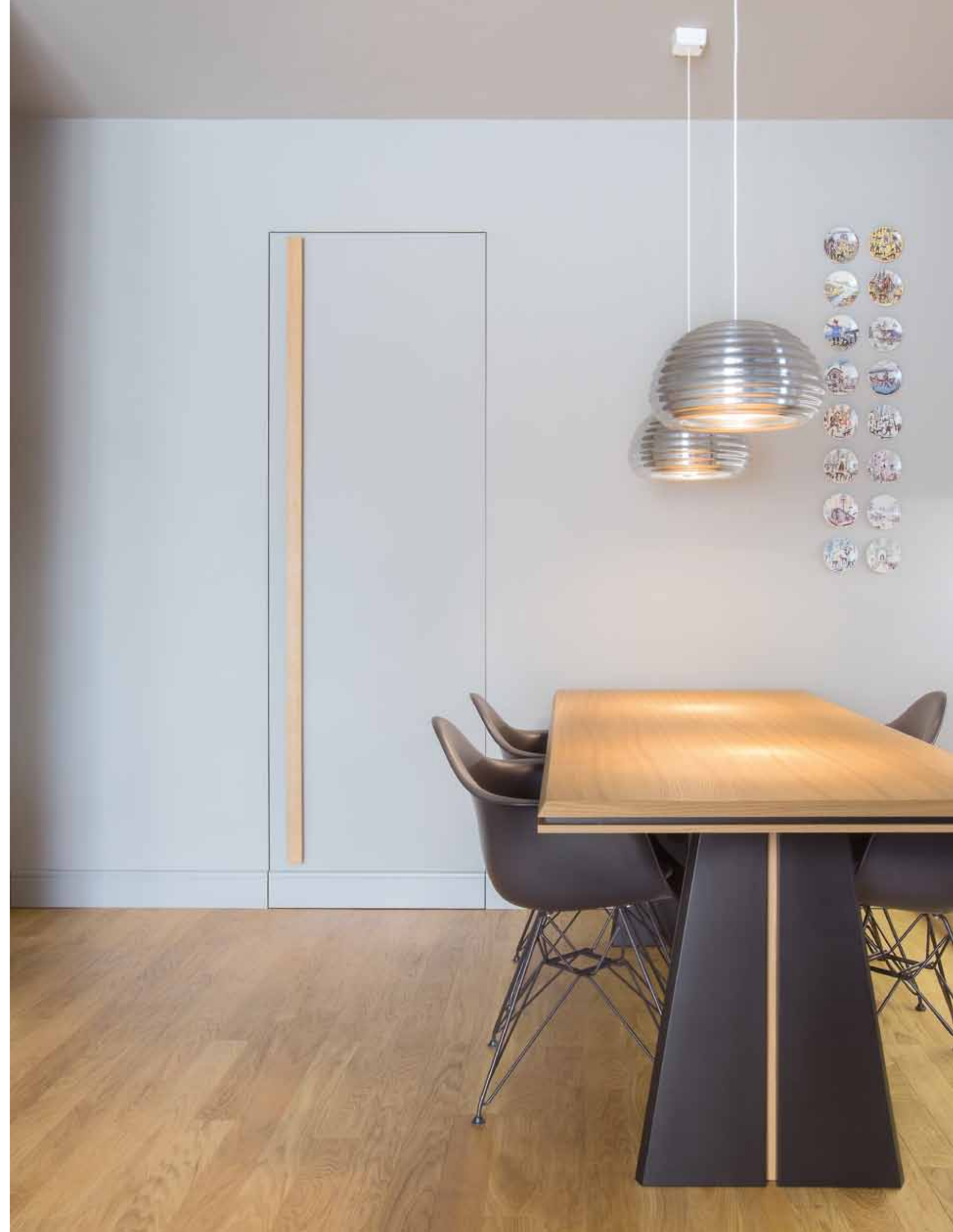
Sopra: le nicchie di cartongesso moltiplicano lo spazio creando una tridimensionalità inaspettata. Tagli che si interrompono lasciando spazio alle porte. A destra: a soffitto sospensioni Splügen Bräu di Achille e Piergiacomo Castiglioni prodotte da Flos. Intorno al tavolo sedie Plastic Armchair DAR - Charles & Ray Eames per Vitra.