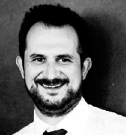
arch. andrea rubini