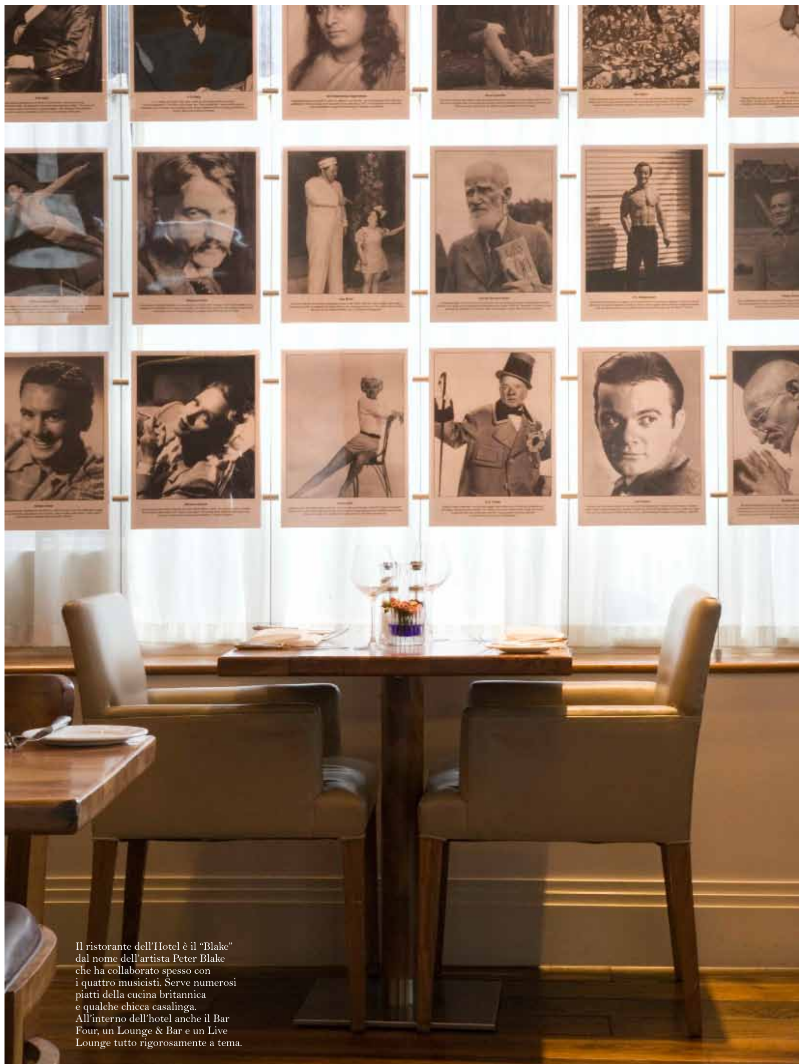
Il ristorante dell'Hotel è il "Blake" dal nome dell'artista Peter Blake che ha collaborato spesso con i quattro musicisti. Serve numerosi piatti della cucina britannica e qualche chicca casalinga. All'interno dell'hotel anche il Bar Four, un Lounge & Bar e un Live Lounge tutto rigorosamente a tema.