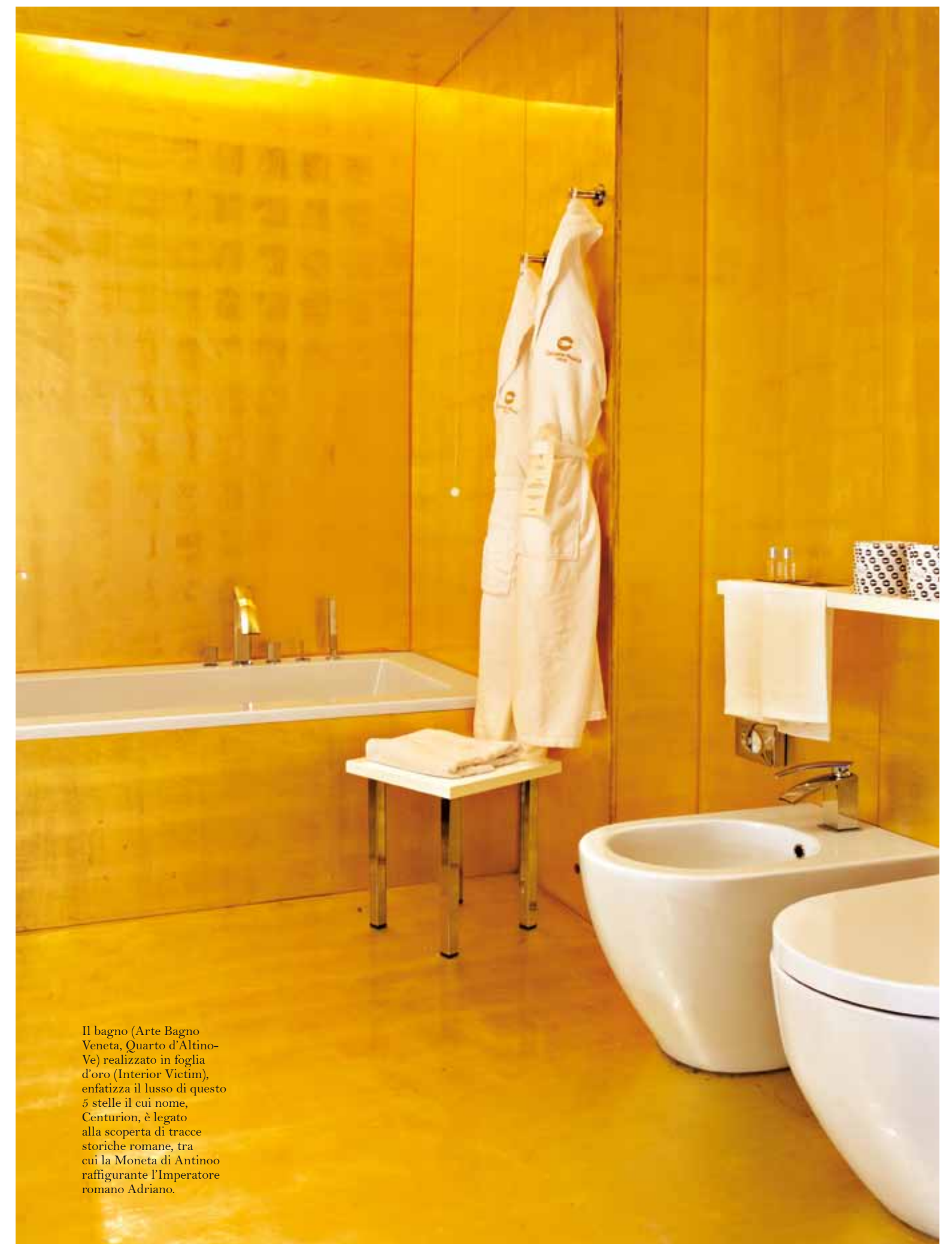
Il bagno (Arte Bagno Veneta, Quarto d'Altino-Ve) realizzato in foglia d'oro (Interior Victim), enfatizza il lusso di questo 5 stelle il cui nome, Centurion, è legato alla scoperta di tracce storiche romane, tra cui la Moneta di Antinoo raffigurante l'Imperatore romano Adriano.