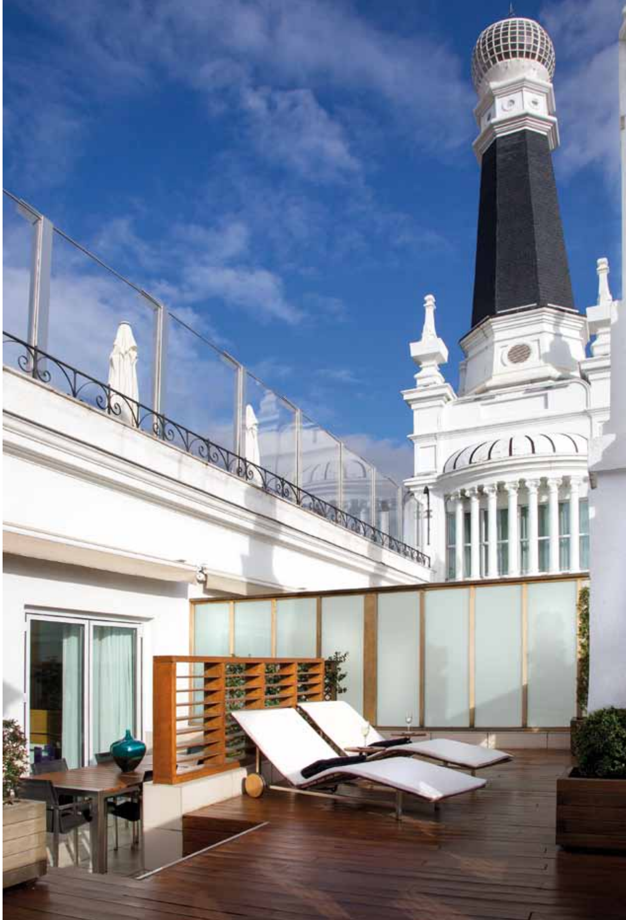
L'esterno dell'hotel è di rara bellezza, con grandi torri che ospitano le suite e il bianco del palazzo che stacca maestoso sul resto. Sono state ricavate varie terrazze per godere del panorama cittadino e permettere agli ospiti di mangiare all'aperto, quando la stagione lo permette.