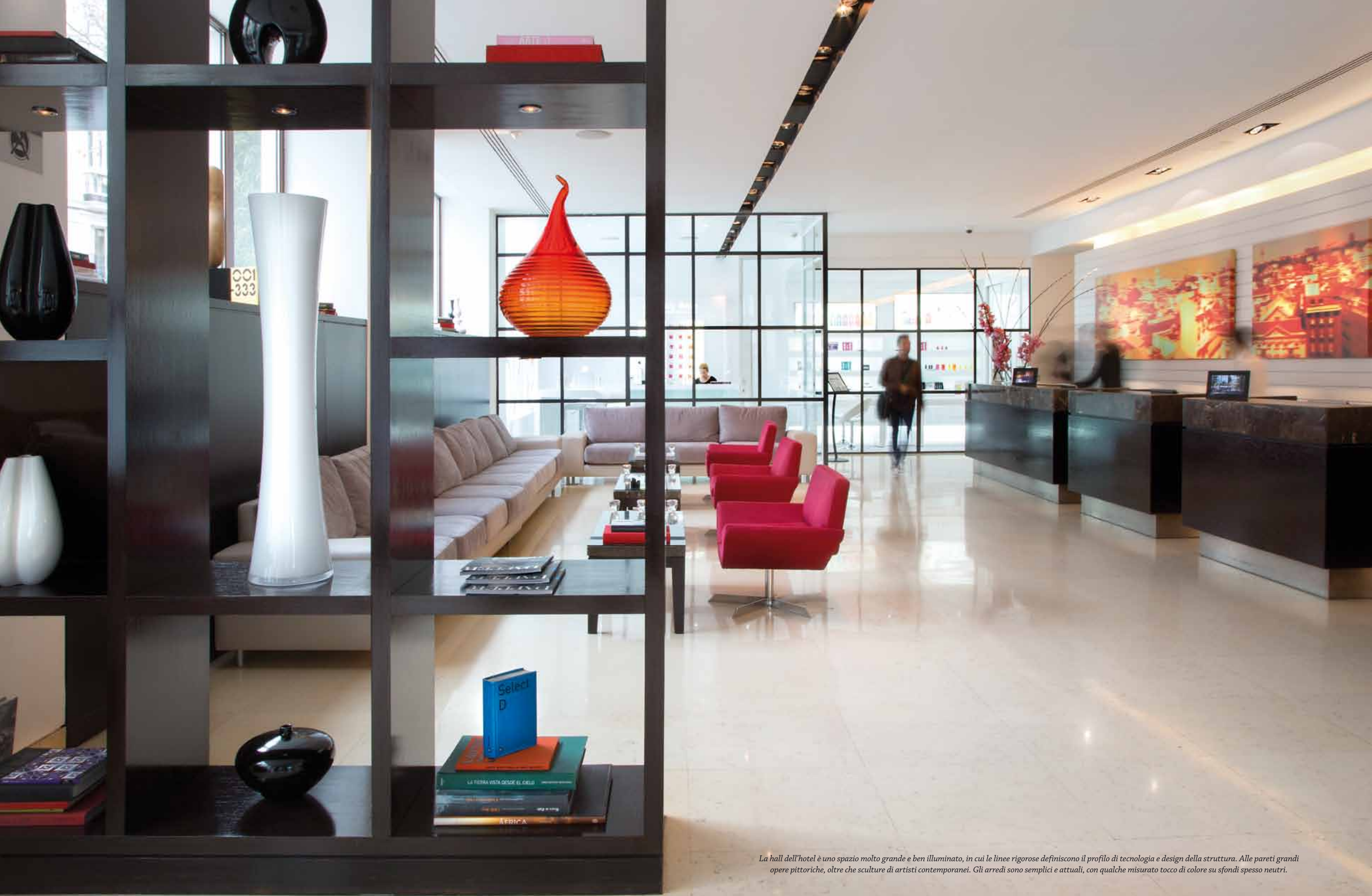
La hall dell'hotel è uno spazio molto grande e ben illuminato, in cui le linee rigorose definiscono il profilo di tecnologia e design della struttura. Alle pareti grandi opere pittoriche, oltre che sculture di artisti contemporanei. Gli arredi sono semplici e attuali, con qualche misurato tocco di colore su sfondi spesso neutri.