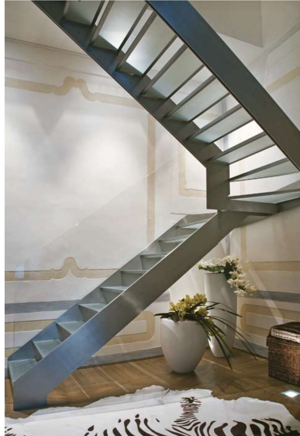
Per raggiungere l'ultimo piano, scala in vetro trasparente extra light e acciaio spazzolato per la struttura. Il tappeto zebra accende la stanza dando un sapore sottilmente ludico ed elegante.