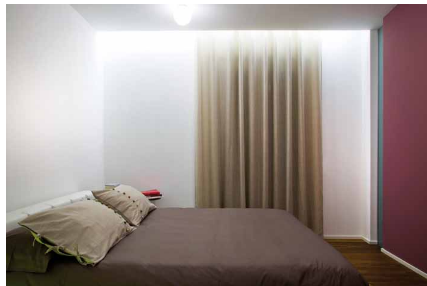
La camera da letto è semplice e lineare, con il letto in pelle bianca trapuntata, le cornici vintage recuperate e verniciate di bianco ed un aggraziato drappeggio con binario a scomparsa (Stil-Art). La lampada da comodino è in silicone e dà un tocco di colore alla stanza. Il controsoffitto ha un taglio di luce in cui è alloggiata una striscia di led. A soffitto è inoltre visibile un gioco di sfere luminose: si tratta di un trittico distribuito in modo irregolare.