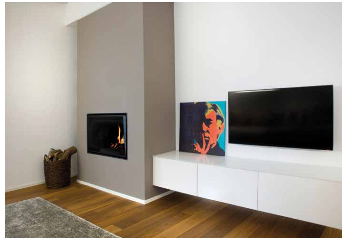
A sinistra: il dettaglio dell'innovativo taglio di luce che sovrasta il divano. È interessante notare il dettaglio del binario in acciaio lucido che sostiene il drappeggio (fornitura Stil-Art). Sopra: giochi geometrici del living con il mobile sospeso ricoperto da cristallo bianco extrachiario.