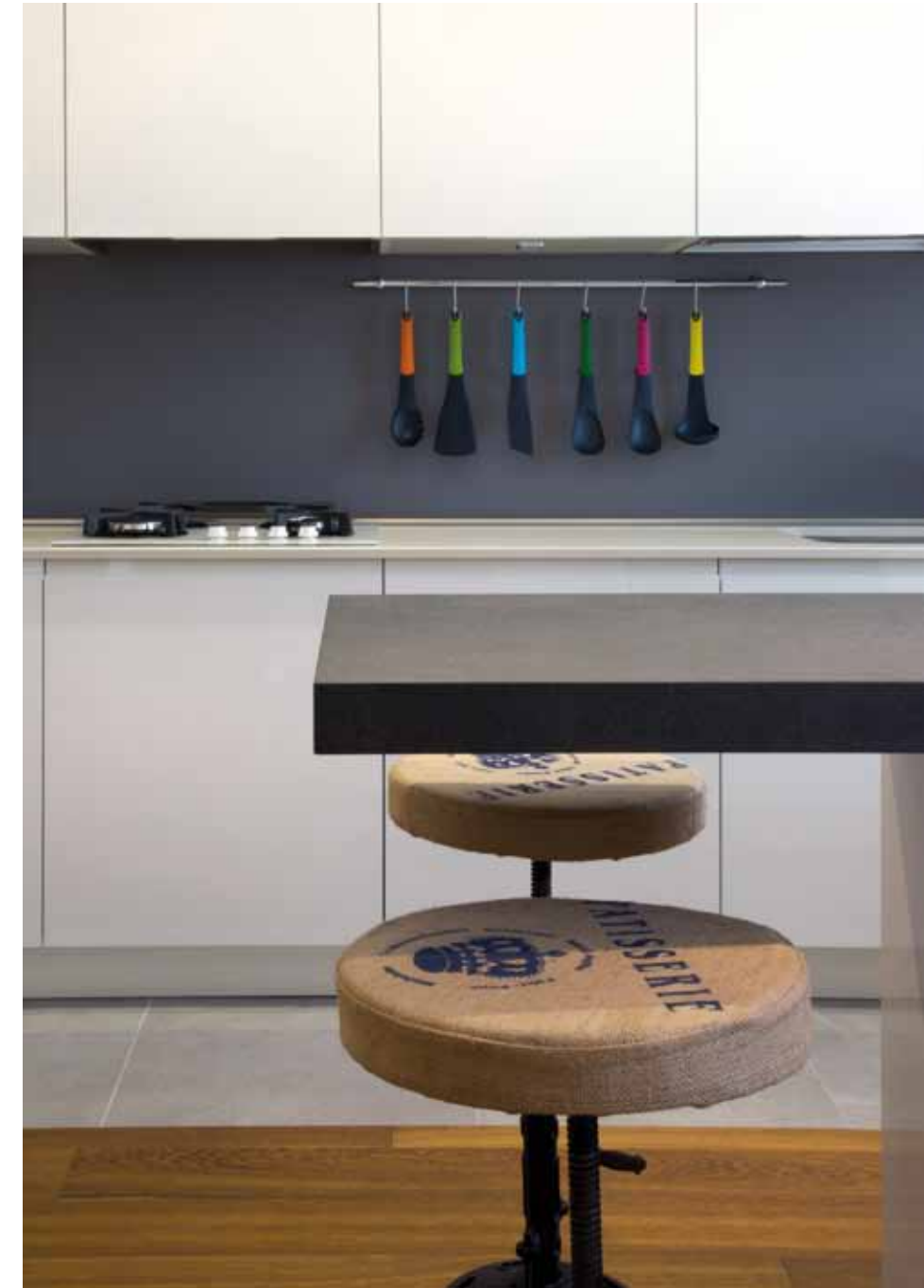
Vista della cucina, con il blocco penisola con piano a sbalzo destinato alla colazione, accompagnato da splendidi sgabelli vintage. Il rivestimento è uniformemente in cristallo bianco extrachiario. Alla finestra una deliziosa tenda a pacchetto con aste in tessuto, coordinata ai drappaggi del living (Stil-Art).