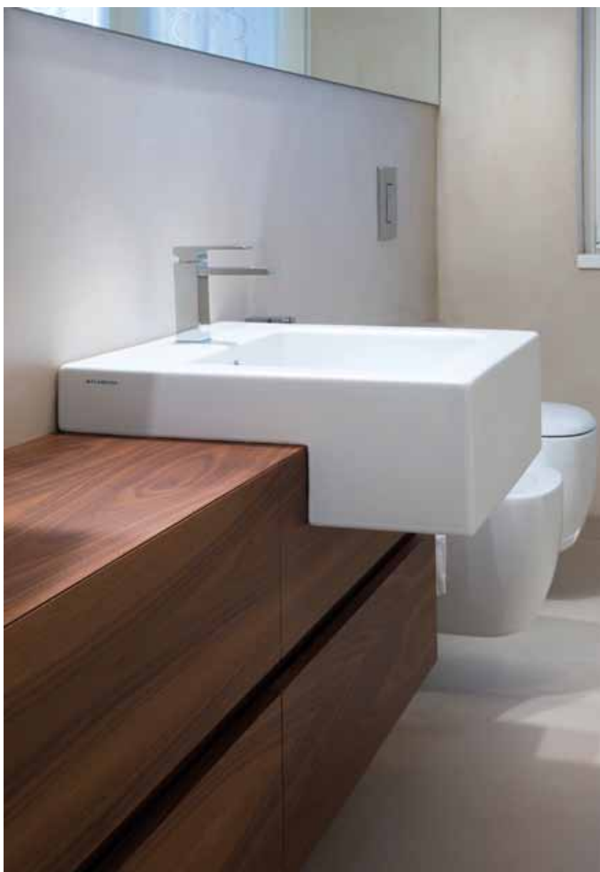
Il bagno è realizzato in resina colore tortora, con un mobile in noce con semincassato un lineare lavabo, il tutto sovrastato da uno specchio di 3 metri.