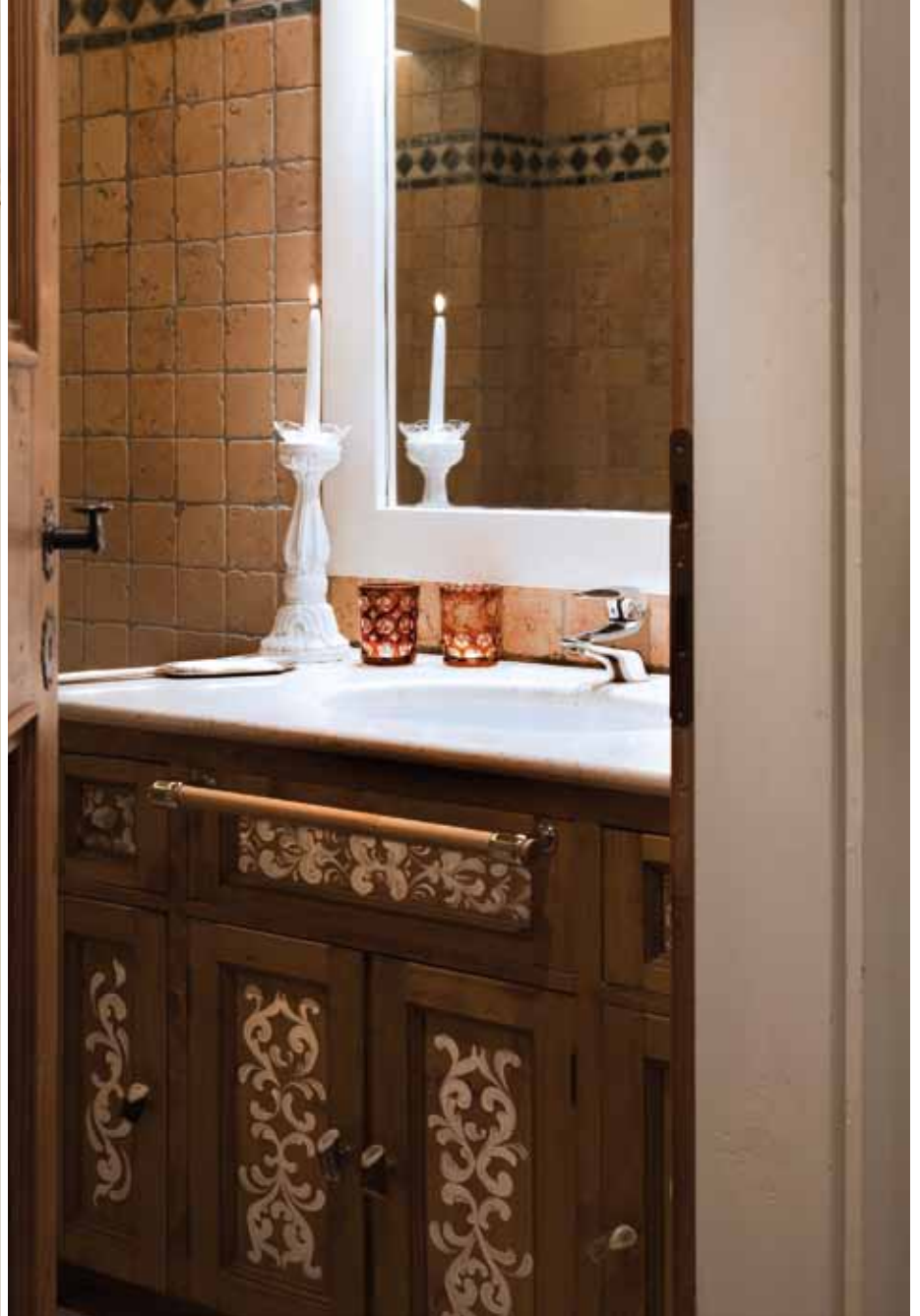
A sinistra: la porta che dal corridoio della zona notte accede al living è sovrastata da una cimasa intarsiata bianca. A destra: il mobile del bagno dipinto a mano in stile ampezzano.