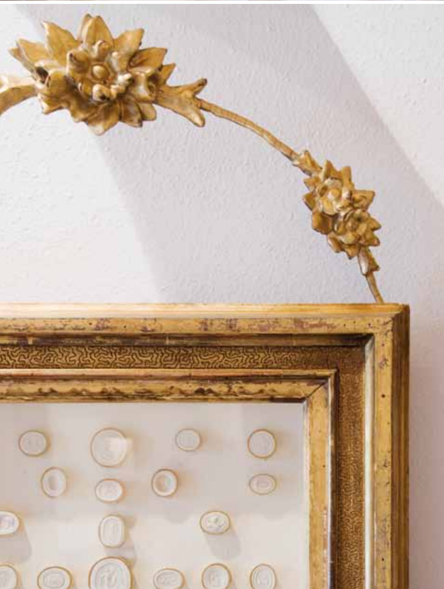
Cornici dorate impreziosiscono le pareti e fanno da contorno a rare e preziose collezioni di gessi ed avori. A destra: contemporaneità e tradizione a confronto: sopra il letto moderno imbottito, un quadro di famiglia e di fianco un tavolino di recente produzione.