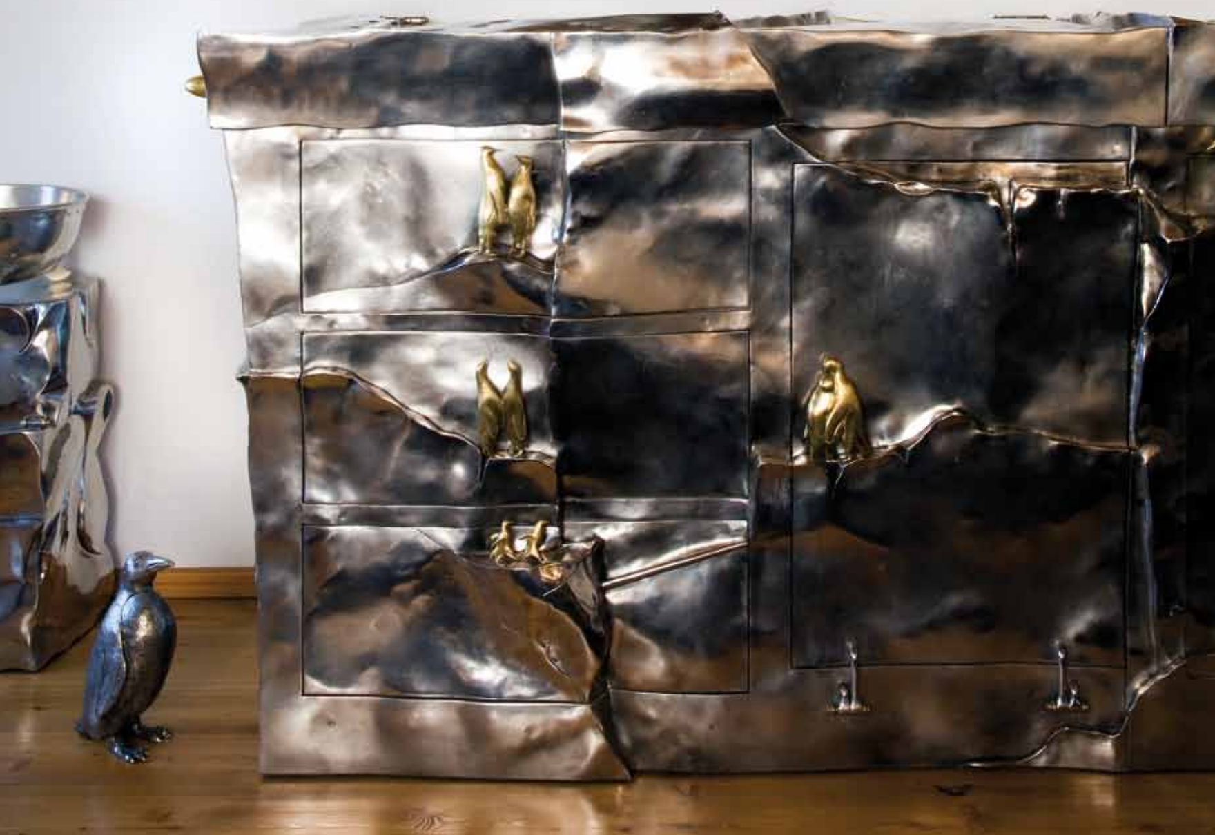
A sinistra: la cucina "iceberg" in acciaio inox forgiato e lucidato è stata realizzata da Giancarlo Candea. Le maniglie sono in ottone a forma di pinguino. Il mobile ha un coperchio che chiude e rende le parti funzionali a scomparsa. Sopra: un dettaglio del piano di lavoro. In alto a destra: una rarissima collezione di slitte vittoriane in argento. A lato: in continuità con lo stile del blocco cucina, due sgabelli sempre realizzati in acciaio inox forgiato e lucidato.