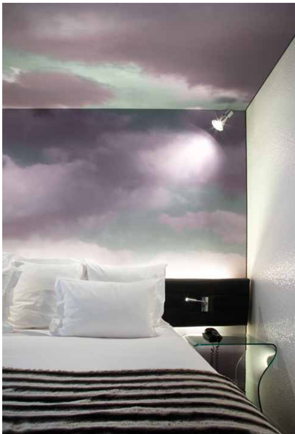
Incantevoli le camere da letto, piccole ma di sicuro effetto grazie alle imponenti elaborazioni grafiche che ricoprono le pareti.

dove Hotel 7Eiffel 17 Bis Rue Amelie 75007 Paris prenotazione tel +33 1 45 55 10 01 reservation@7eiffel.com