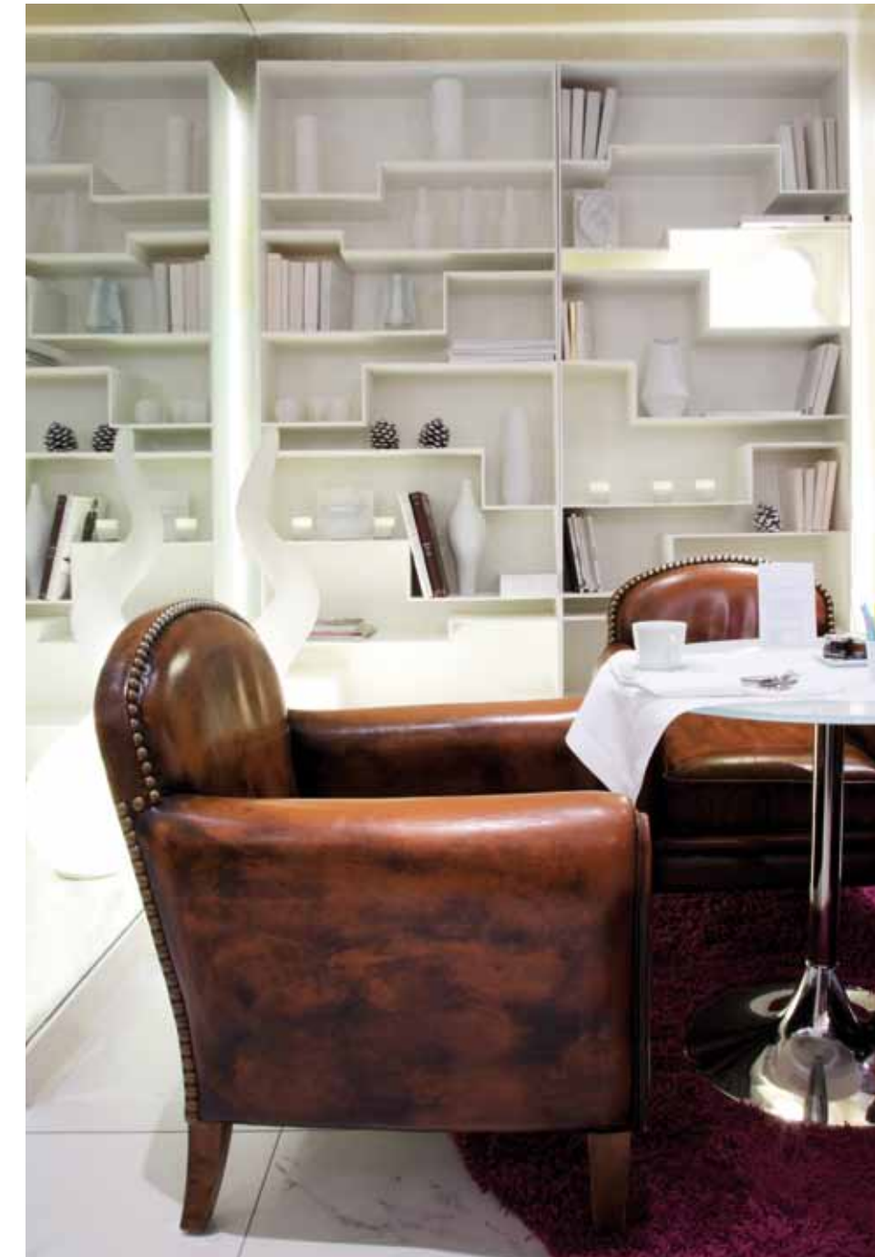
Nella sala delle colazioni, piccoli spazi raccolti per l'intimità, enfatizzati da grandi specchiere e riscaldati dal vicino camino. A disposizione del pubblico, librerie dalle linee spezzate, realizzate artigianalmente.