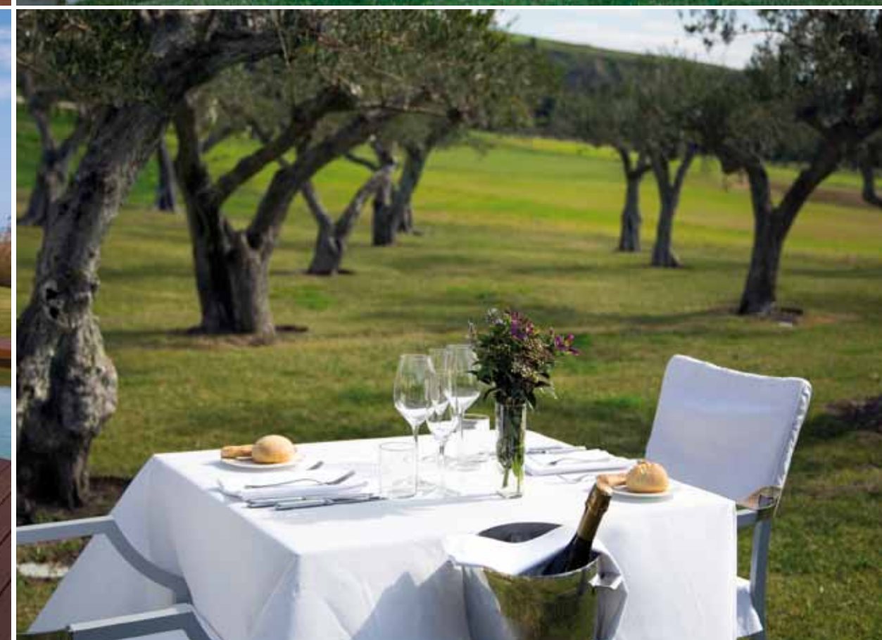
Diversi spaccati del Resort: acqua, benessere e vegetazione rigogliosa. Alcune camere dispongono di una piscina privata che dà sul campo da golf disegnato da Kyle Phillips, un affaccio davvero mozzafiato.