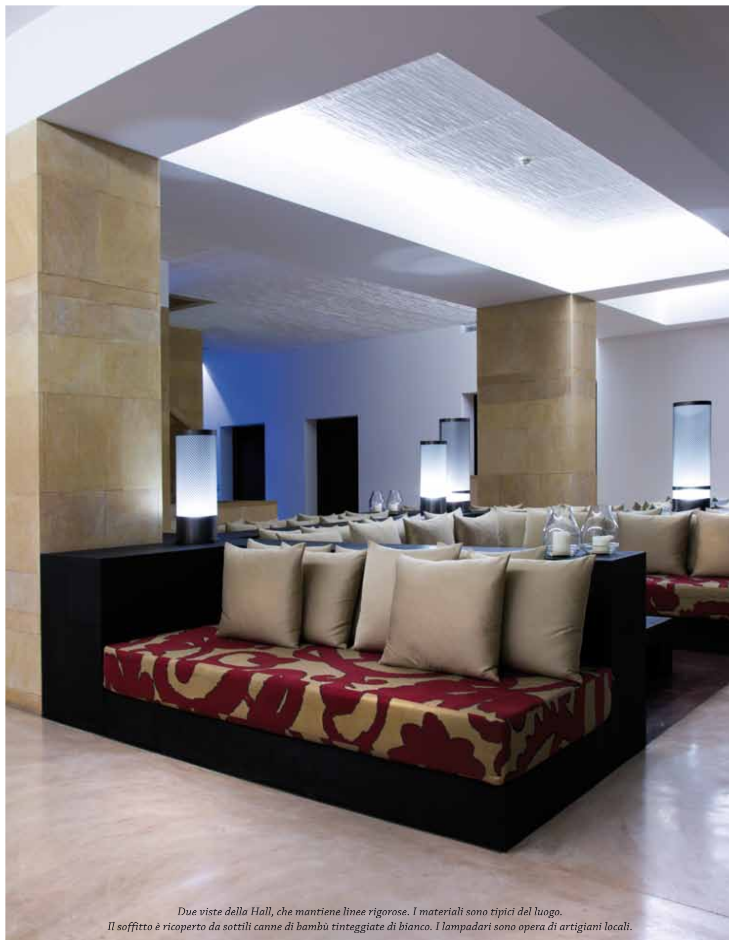
Due viste della Hall, che mantiene linee rigorose. I materiali sono tipici del luogo. Il soffitto è ricoperto da sottili canne di bambù tinteggiate di bianco. I lampadari sono opera di artigiani locali.