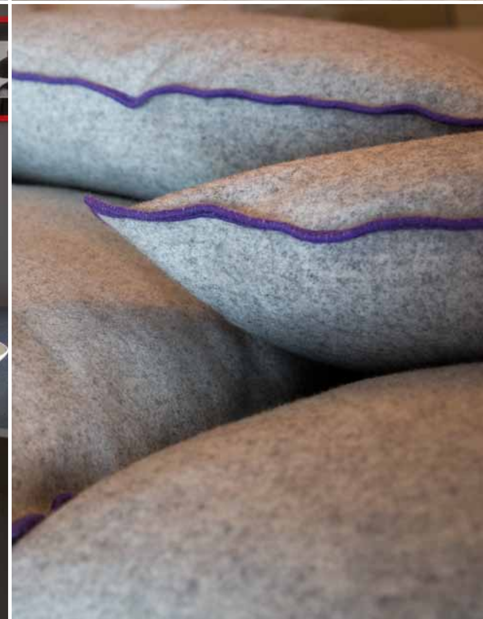
Il divano Ghost (Gervasoni) è un elemento identificativo dello spirito della casa, dinamico e colorato. Le pareti si alternano tra grigio e bianco, dove in modo casuale troviamo divertenti applicazioni: gli stickers sono un'idea spiritosa e a basso costo per dare personalità ad ogni angolo dell'abitare. A destra: un dettaglio della sala da pranzo: tavolo in legno grigio e pietra grafite abbinato alle sedie in legno, entrambi di Gervasoni. Anche in questo caso il rosso non manca: sul tavolo una ciliegia realizzata in Brasile con pigmenti naturali.