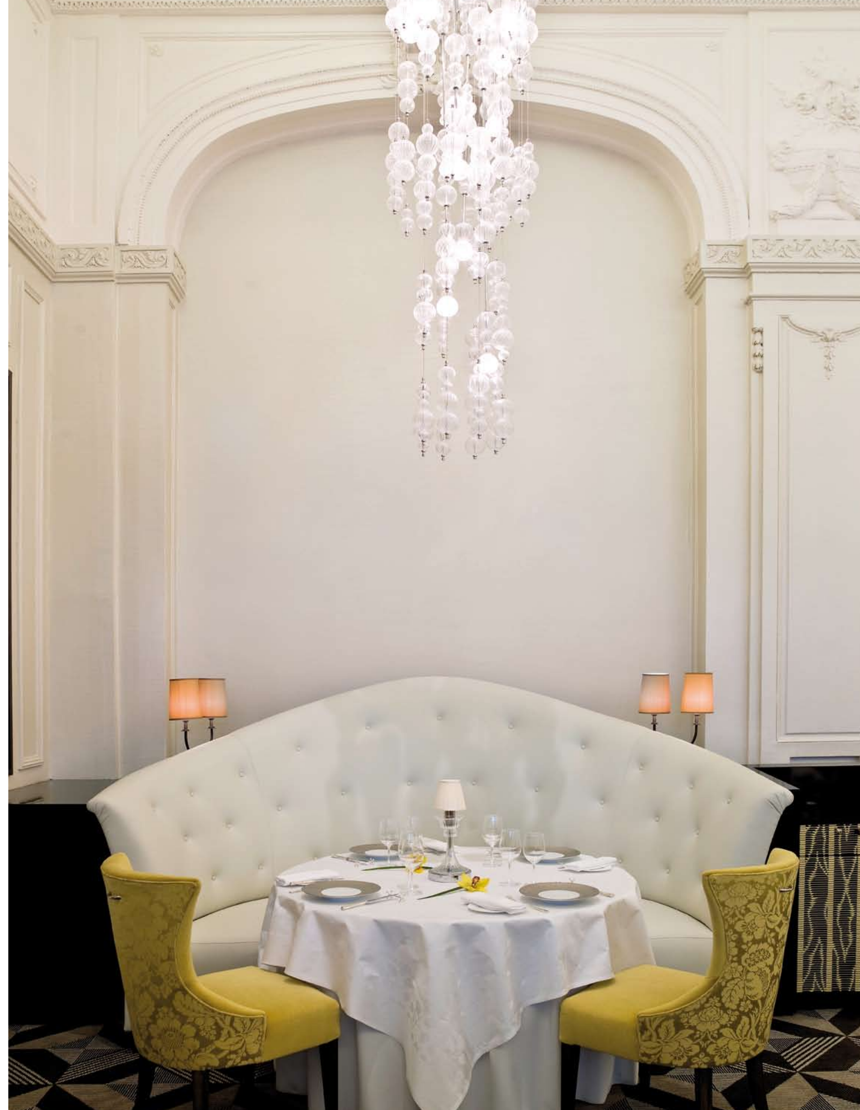
Il Trianon Palace Versailles ospita il Gordon Ramsay au Trianon - il primo ristorante gourmet del celebre chef in Francia, affiancato da un secondo ristorante diretto dallo stesso Ramsay.