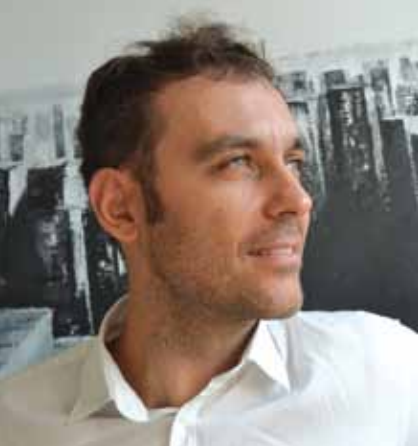
arch. enrico zanoni