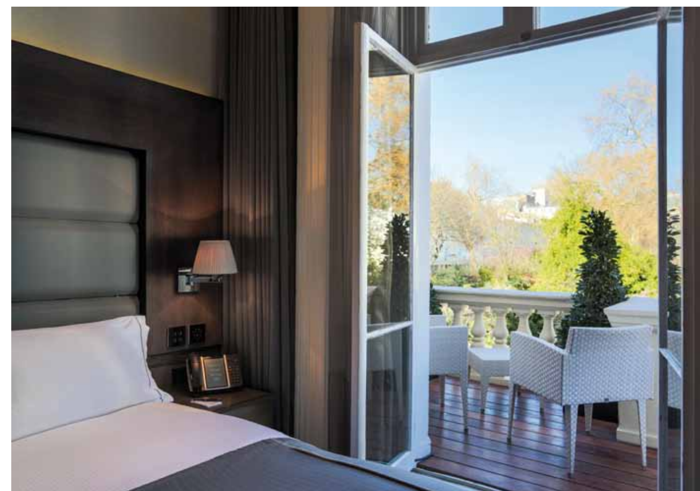
Le camere, pur avendo dimensioni contenute, sono curate e accoglienti. I letti Hastens da 12.000 sterline sono una vera oasi del riposo, con lo schienale regolabile e il massaggio suddiviso in 3 zone. Il bagno è diviso dalla zona notte da un vetro intelligente che si oscura grazie alla domotica.