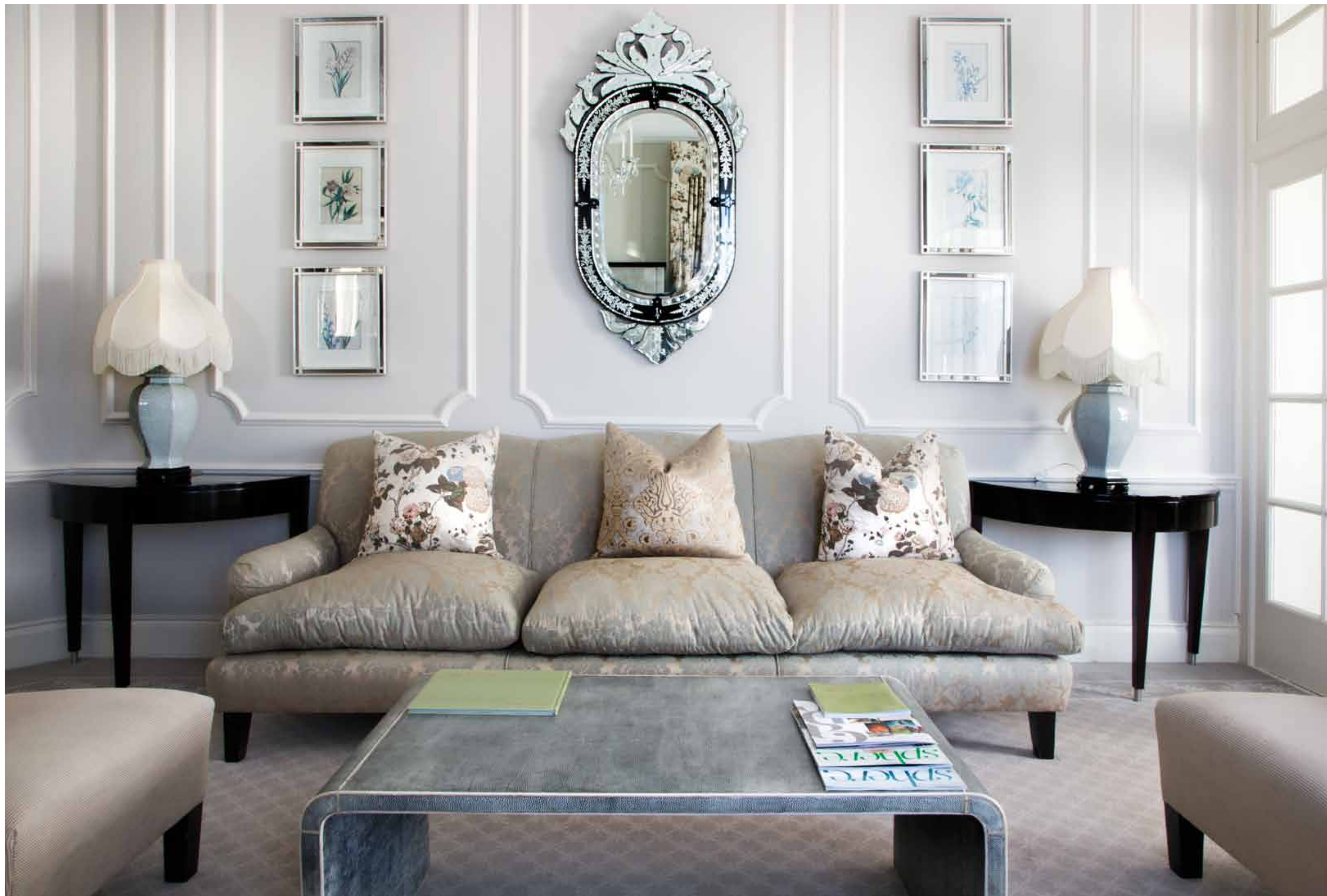
L'hotel divide l'edificio storico in sei ali ciascuna con proprie caratteristiche e una bella vista sulla Table Mountain. Ogni camera gode della massima riservatezza oltre che di numerosi comfort: aria condizionata a controllo individuale, biancheria di lusso e cuscini anallergici in schiuma, illuminazione regolabile, televisore via satellite, registratore, due linee telefoniche, Internet a connessione veloce.