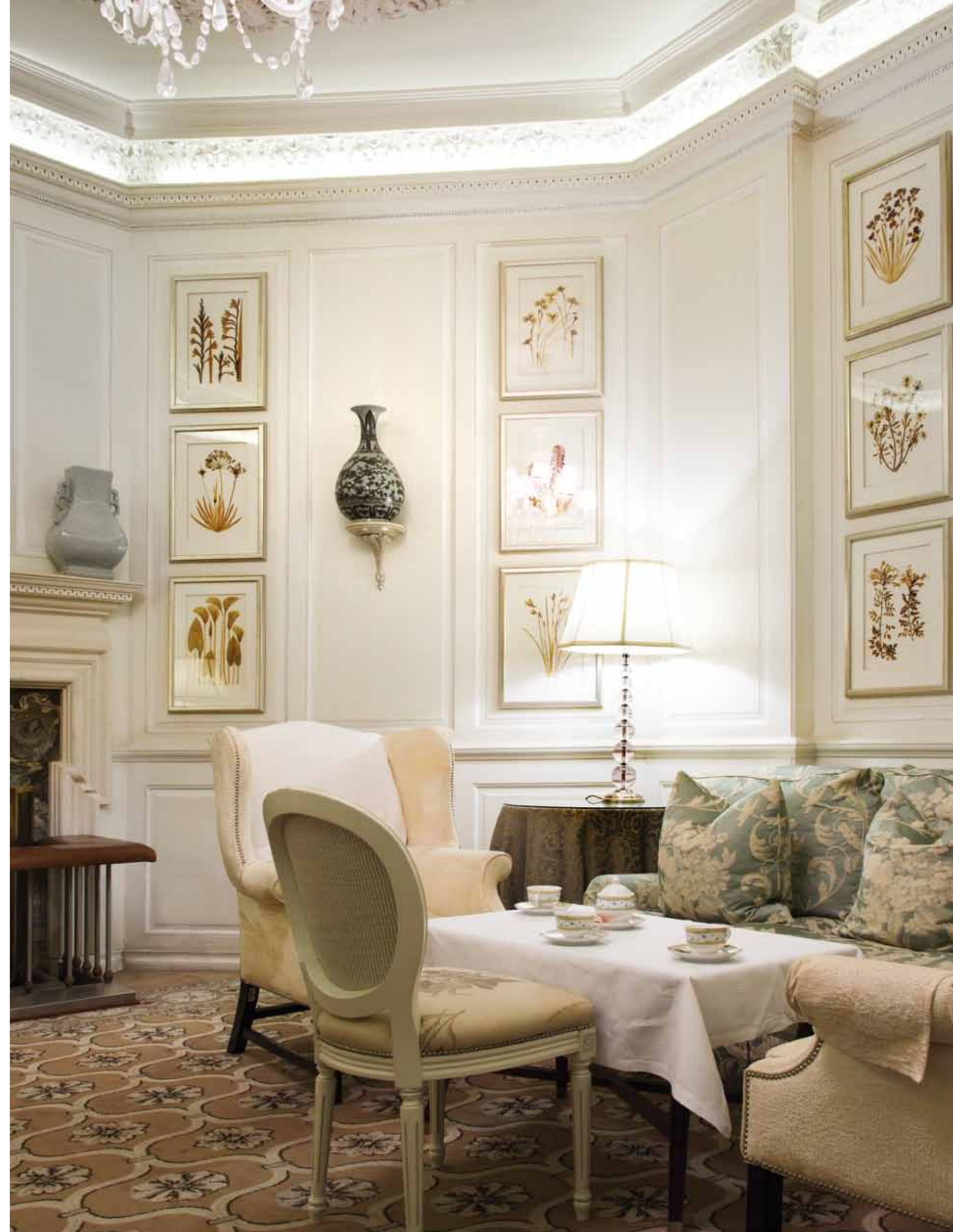
L'Afternoon tea, divenuto di moda nella prima metà dell'800, viene qui servito in veranda e nella Lounge Windsor Table. Nominato più volte "miglior tè del mondo", propone un'infinità di prelibatezze tra il dolce e il salato.