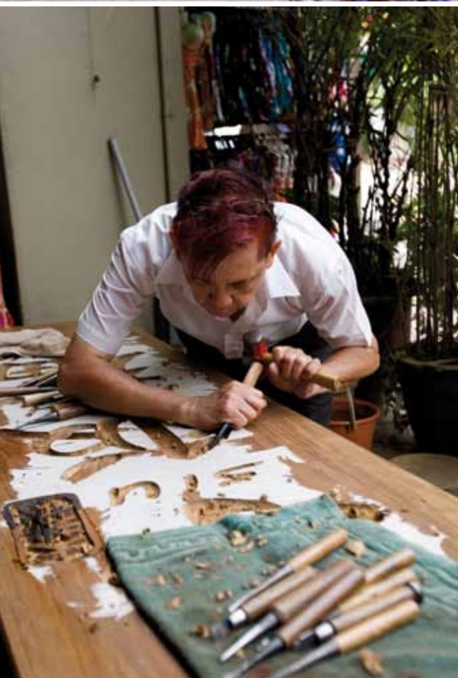
L'isola offre un artigianato notevole. In particolare la lavorazione del legno propone al turista cornici, porte o specchi magistralmente incisi.

Chi invece – come me - ama il golf, si lascerà tentare da Urban Fairways (168, Robinson Road) un divertente spazio/ludoteca in cui trovare simulatori di tutti i campi da golf del