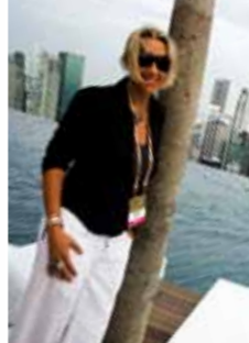
• ph e testo di Betty Colombo