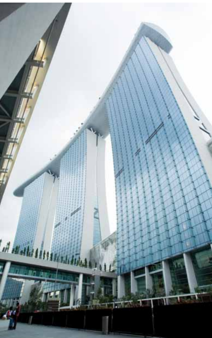
Vista dal basso del Marina Bay Sands, imponente ed affascinante.

Se visitate Singapore non potete assolutamente perdervi il Marina Bay Sands strepitoso esempio di architettura futuristica, con la piscina sospesa più grande del mondo ed un'impagabile skyline sulla città.