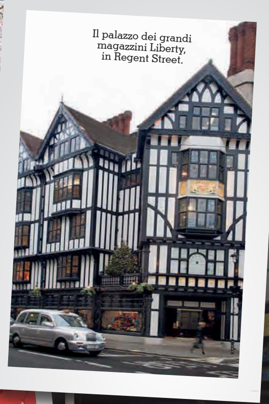
Il palazzo dei grandi magazzini Liberty, in Regent Street.