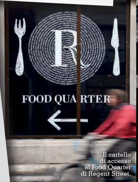
Il cartello di accesso al Food Quarter di Regent Street.