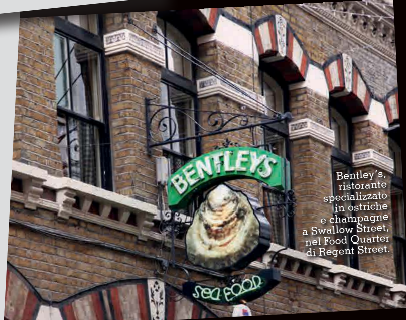
Bentley's, ristorante specializzato in ostriche e champagne a Swallow Street, nel Food Quarter di Regent Street.