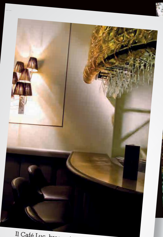
Il Café Luc, brasserie a Marylebone High Street.