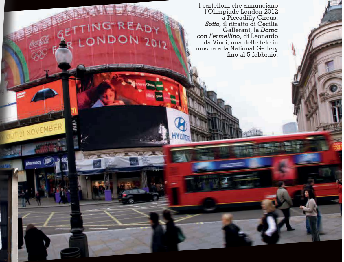
I cartelloni che annunciano l'Olimpiade London 2012 a Piccadilly Circus. Sotto, il ritratto di Cecilia Gallerani, la Dama con l'ermellino , di Leonardo da Vinci, una delle tele in mostra alla National Gallery fino al 5 febbraio.