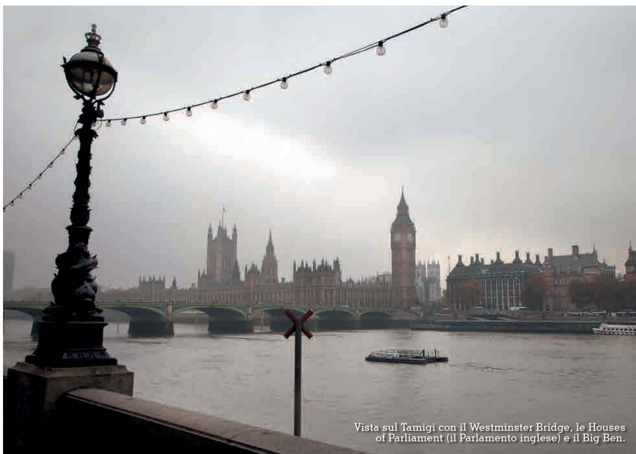
Vista sul Tamigi con il Westminster Bridge, le Houses of Parliament (il Parlamento inglese) e il Big Ben.

le Tudor, da Anthropologie e al primo Apple Store europeo. Che Regent Street sia anche una meta culinaria esclusiva, però, lo scopriamo solo con il Food Safari, altra iniziativa «limited edition» (si terrà solo le prime due settimane di marzo). Si tratta di un percorso a tappe attraverso il quale si degusta una selezione di piatti gourmet nei migliori ristoranti del Regent Street Food Quarter. Noi abbiamo aperto con capesante gratinate da Fishworks, continuato con ostriche e champagne da Bentley's, per concludere con il risotto