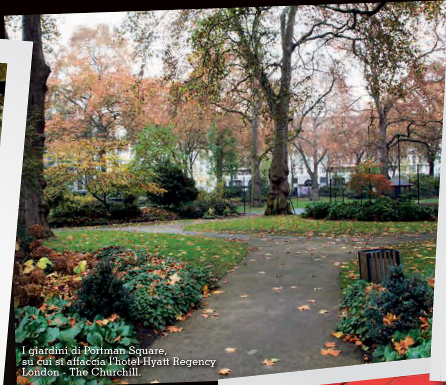
I giardini di Portman Square, su cui si affaccia l'hotel Hyatt Regency London - The Churchill.