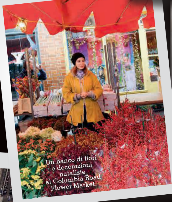
Un banco di fiori e decorazioni natalizie al Columbia Road Flower Market.