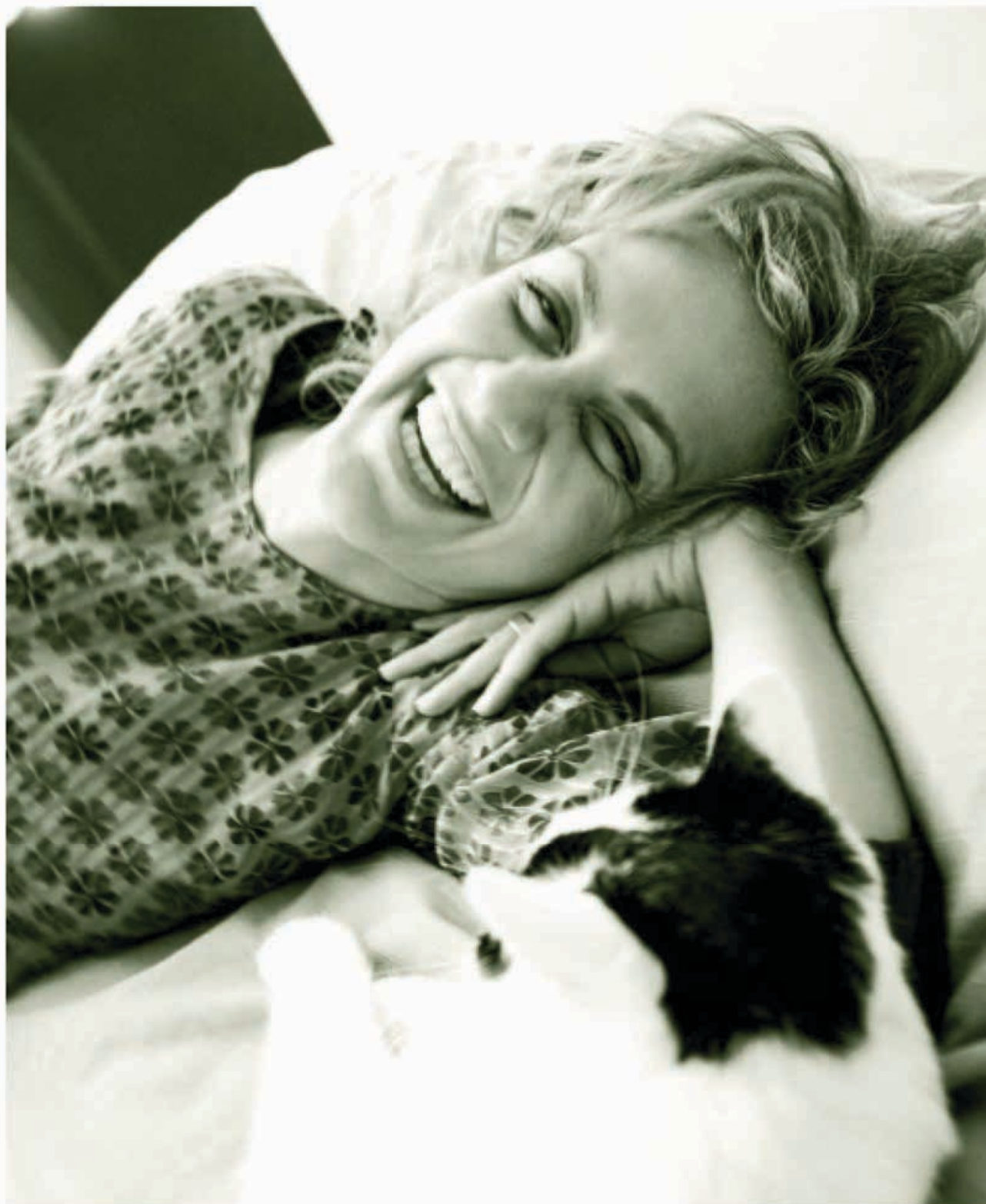
A FIANCO. ANCORA LA VULCANICA ARTISTA TOSCANA IN COMPAGNIA DEL SUO GATTO.